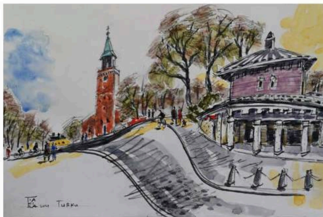
トゥルク大学への道 (41cm × 29cm) Tie Turun yliopistoon