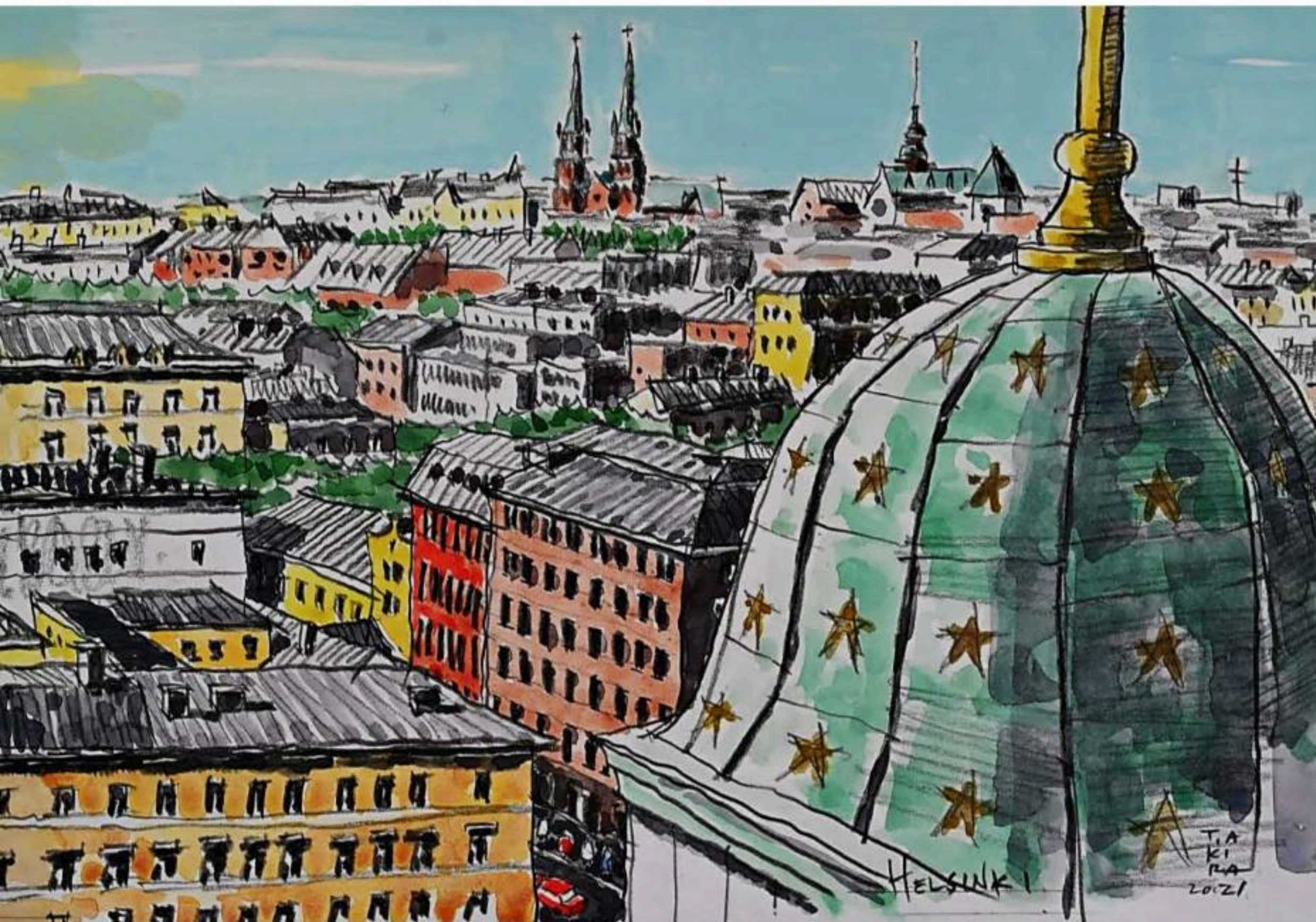
ヘルシンキの屋根 1 (32cm × 21cm) Helsingin kattomaisema 1