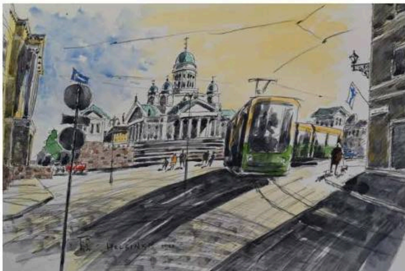
早朝の元老院広場・ヘルシンキ (48cm × 29cm) Aamuvarhaisella Senaatintorilla