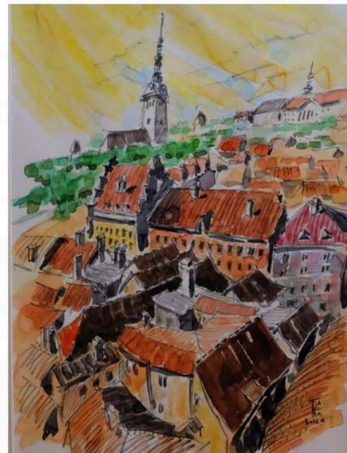
屋根のある風景・タリン (30cm × 41cm) Tallinnan kattomaisema